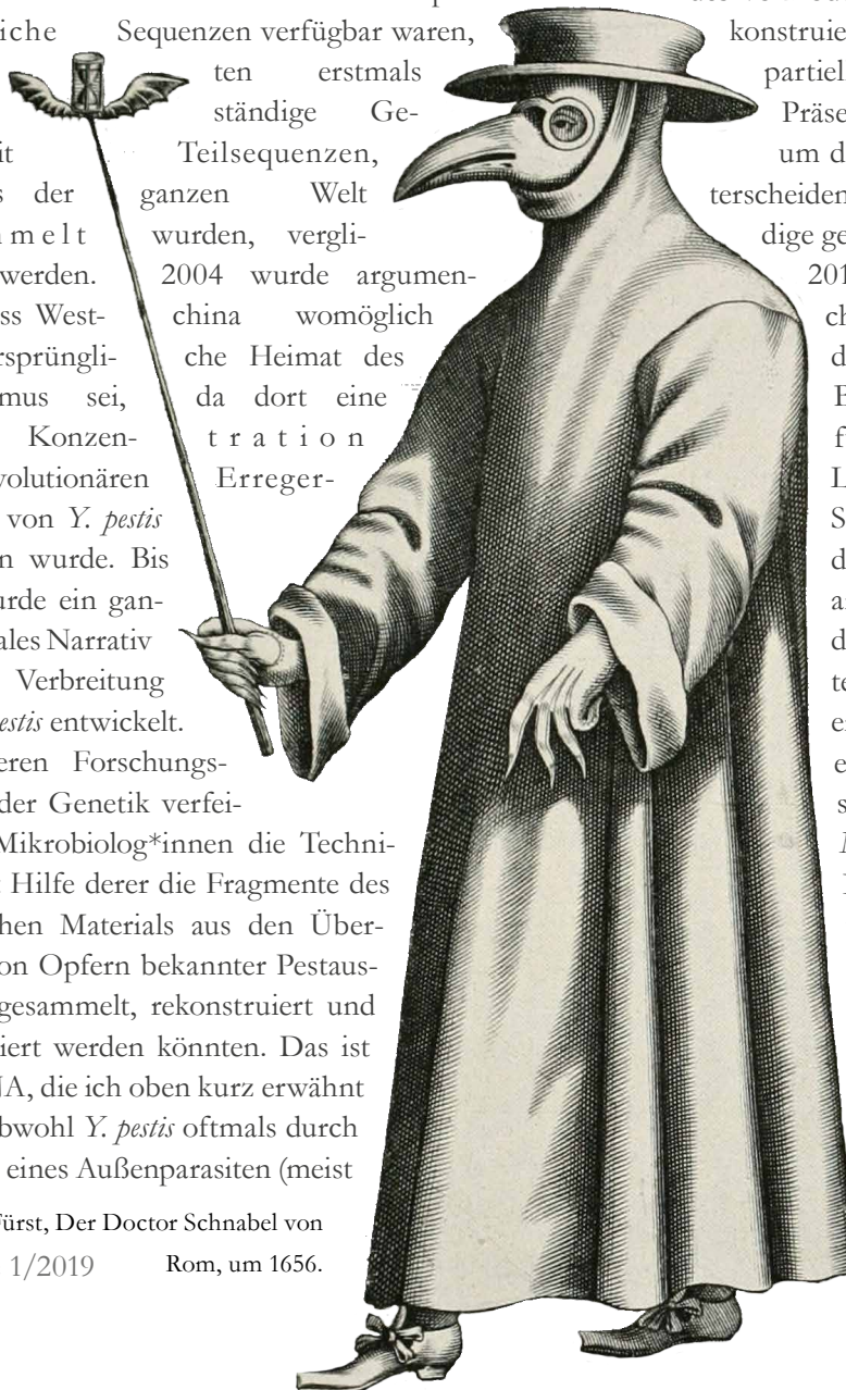
Paul Fürst, Der Doctor Schnabel von Rom, um 1656. Ausgabe 1/2019

Im Jahr 2013 griff ein weiteres internationales Forscherteam die Veröffentlichung der Tübinger/McMaster-Gruppe auf und stellte die sequenzierten aDNA-Genome in einem überarbeiteten phylogenetischen Baum dar, der auf 133 vollständigen Genomsequenzen