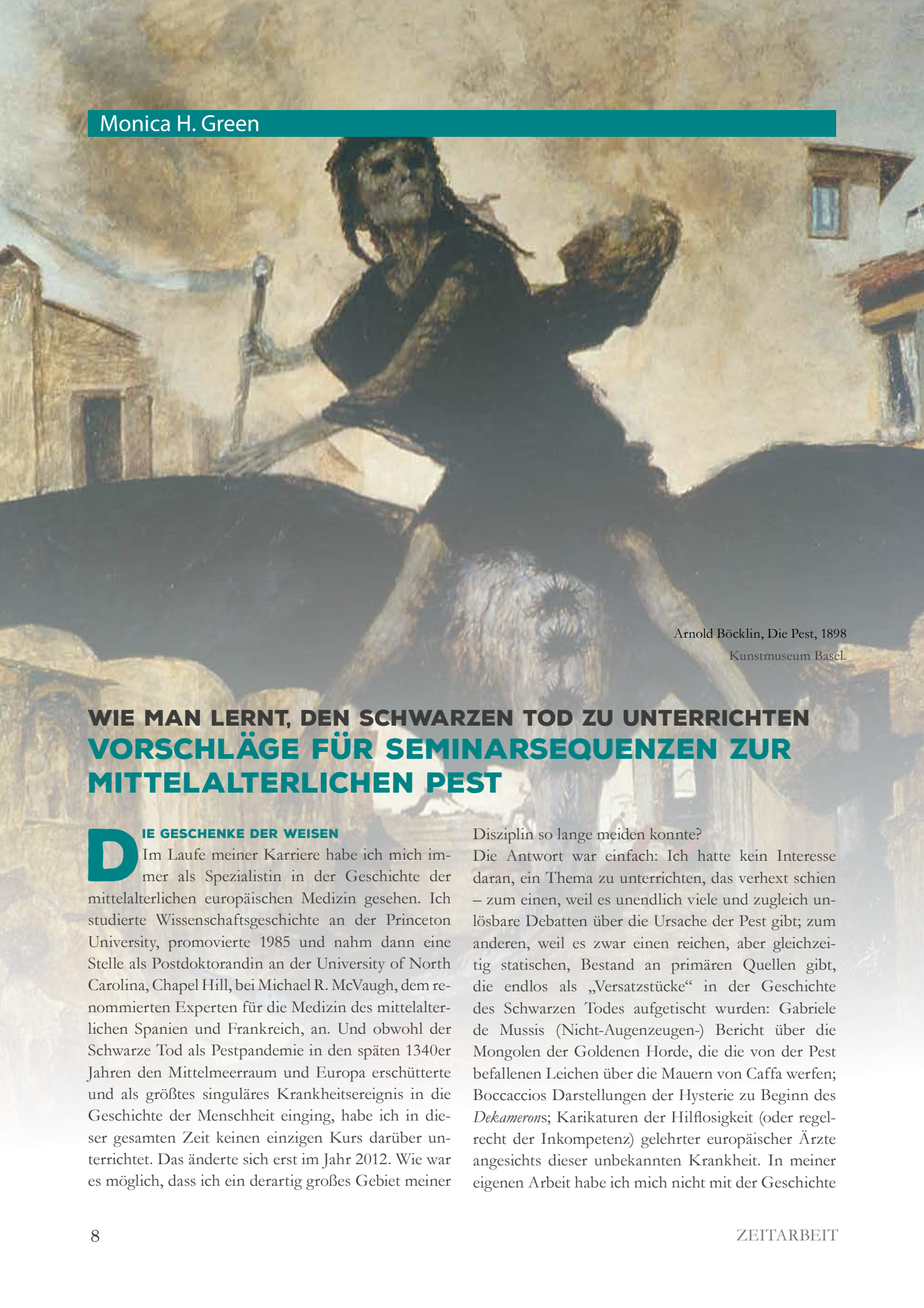
Arnold Böcklin, Die Pest, 1898 Kunstmuseum Basel.