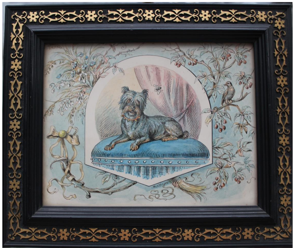
Hund auf Kissen, Aquarell, Albert Kappis (fälschlicherweise) zugeschrieben (ca. 1836).