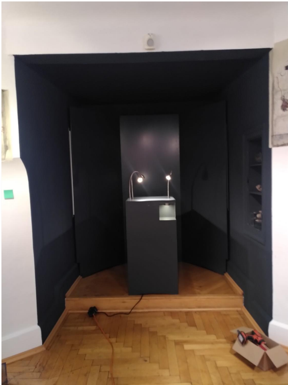
Der neu gestaltete Erker für die Hallstätter Urne ( fast fertig )

Ich weiß nicht mehr, ob es die Urne war, die uns auf die Idee gebracht hat oder ob diese Idee sich nur präziserte anlässlich der Urnenentdeckung. Sicher ist, dass wir beschlossen, auf jede Form klassischer Museumsbeschriftung zu verzichten (und genauso sicher ist, dass wir Echterbacher Springprozessierenden später diesen Verzicht wieder etwas einschränkten). Wir sagten also: das klassische Museumsschild enthält eine Information, die jedoch keine Beziehung organisiert. Das mag funktionieren, wenn die Objekte bereits Beziehungen organisieren. Vincent van Goghs Sonnenblumen kann man mit Sonnenblumenjahresölaufleindwandschildern nicht im Mindesten dazu bringen, KEINE Beziehung aufzubauen. Aber ... ein alter Trichinenstempel. Ein Bäckerschrank. Eine Nähmaschine. Oder eben, for that, eine Urne, deren ehemaligen Bewohner wir nicht kennen. Und da entstand die Idee, Fragen zu stellen, die sich Besucher:innen anhand dieses Objektes stellen könnten: