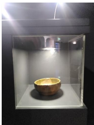
Die Opferschale zur Urne in neuem Licht.

Nun schien also ein neuer Weg für das Museum gefunden: die freie Assoziation verknüpft mit einem Schaudapot und der Möglichkeit der sukzessiven Anreicherung dieses Clusters durch immer neue Wege und Erfahrungen frei nach dem Motto »Zeig mir Dein Museum« oder »Was