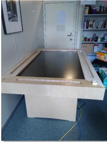
Der fertige Tisch in meinem Büro.

Also: zurück auf Anfang. Gehen Sie nicht über Los, ziehen Sie keine 2000 Euro ein. Monopoly in allen Lebenslagen. Also gut. Wir verwarfen das Design. Schade drum. Das war vielleicht, darum erzähle ich das hier so ausführlich, ein schwer erträgliches Moment dieses Projektes für beteiligte Studierende: auch Ideen, die sorgfältig und klug über ein ganzes Semester entwickelt wurden, mussten sich immer wieder an der Realität dieses kleinen Tettlinger Torschlosses mit all seinen Ecken, Kanten und krummen Winkeln messen lassen. Und damit ist eigentlich weniger die Architektur eines frühneuzeitlichen Baus als die Schwierigkeit, ihn zu einem lebendigen Ort der Auseinandersetzung mit Geschichte zu machen, gemeint. Dennoch: für ein Seminar ist dieses Vorgehen deutlich unbefriedigend und das in einem Format, das doch auf die Steigerung von Motivation und Intensivierung von Lernenergie setzt, mehr noch, eben diese Verbesserung zum eigentlichen Existenzargument macht. Was tut man nun damit? Minimum ist die wertschätzende Rückmeldung und Auseinandersetzung. Dennoch blieb die bange und bang artikulierte Frage der beiden Studenten, die sich mit dem Tischdesign auseinandergesetzt haben: »Und – wird dann irgendetwas davon umgesetzt?« Ja, wird es, ist die Antwort. Ob diese jedoch den Studenten genügt, sei dahingestellt – und das durchaus mit kräftigem Bauchgrimmen.