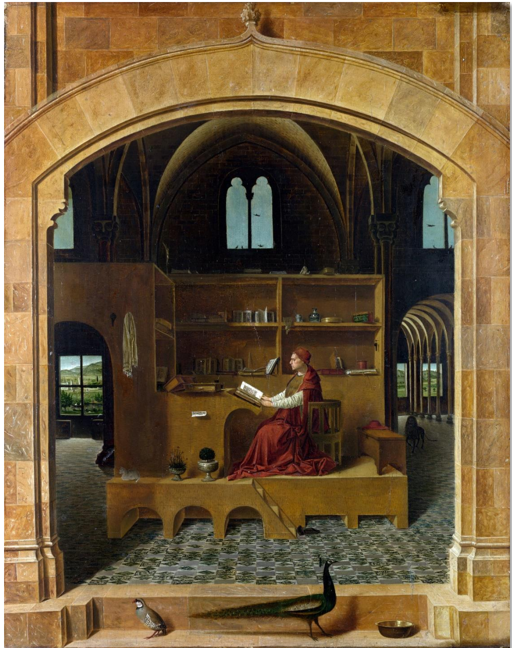
Antonello da Messina: Der hl. Hieronymus im Gehäuse (1475)

Mir drängte sich das Bild des Kirchenvaters Hieronymus im Gehäuse auf – ein klassisches Thema der christlichen Kunst. Es zeigt den durch einen langen Bart als Gelehrten charakterisierten Heiligen, grübelnd mit den typischen Attributen des Totenschädels und des Löwen in einem mehr oder weniger von Büchern überquellenden Studierzimmer. Tiere, allen voran der Löwe, oft Pfau und Rebhuhn, manchmal gar eine ganze Menagerie wuseln darin herum. Das Zimmer ist geschlossen, nur Fenster lassen die Außenwelt herein.